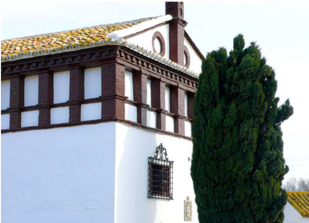
Notre première nuit à VILLANUEVA DEL GRAO