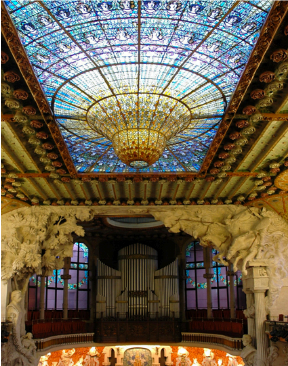
Palais de la musique/ Barcelone