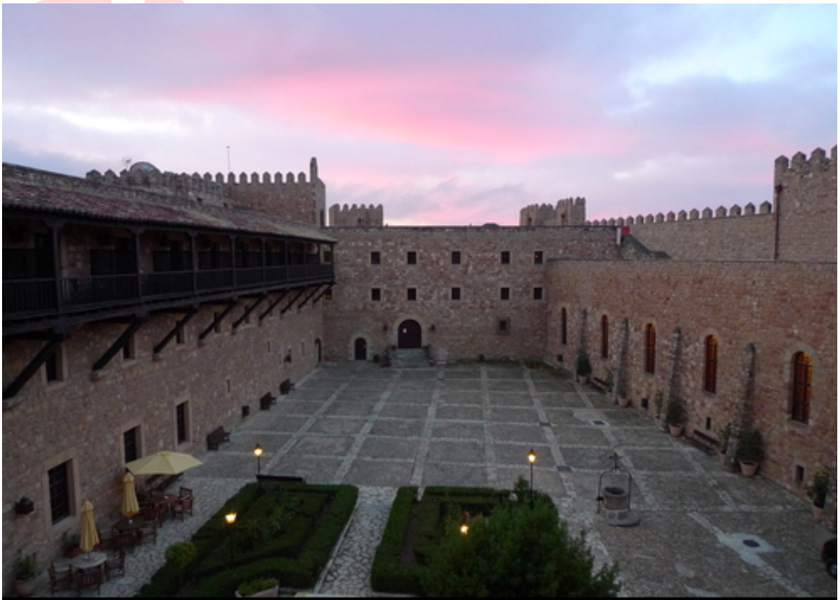
Parador de Siguenza

Avant notre départ, nous ferons une visite d'une manufacture traditionnelle d'accessoires aéronautiques. Route sur SIGUENZA, piste sur un sommet qui domine le village médiéval, joyau de la province de Guadalajara, que nous prendrons le temps de visiter; nous ne quitterons pas le village sans être monté jusqu'au parador pour nous désaltérer. Nuit à Siguenza.