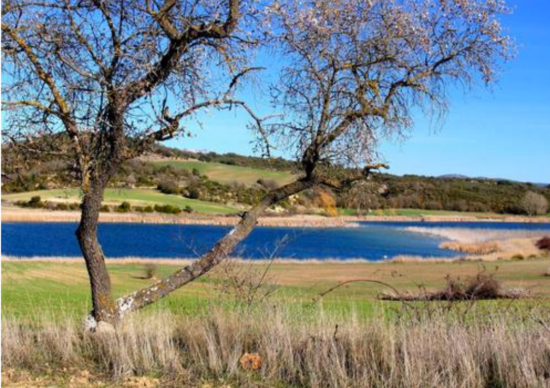
alentours de BENABARRE

Notre voyage commencera par le sud des contreforts des Pyrénées dans la province de Huesca.