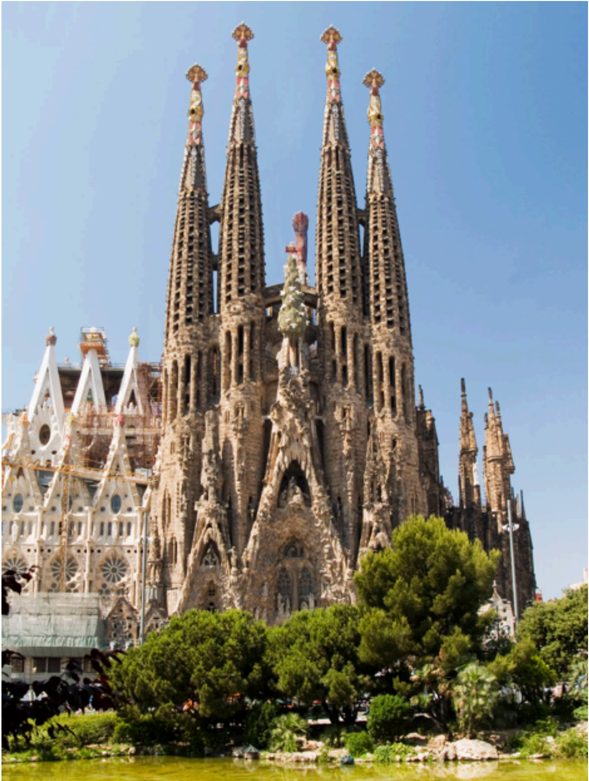
Sagrada familia/ Barcelone