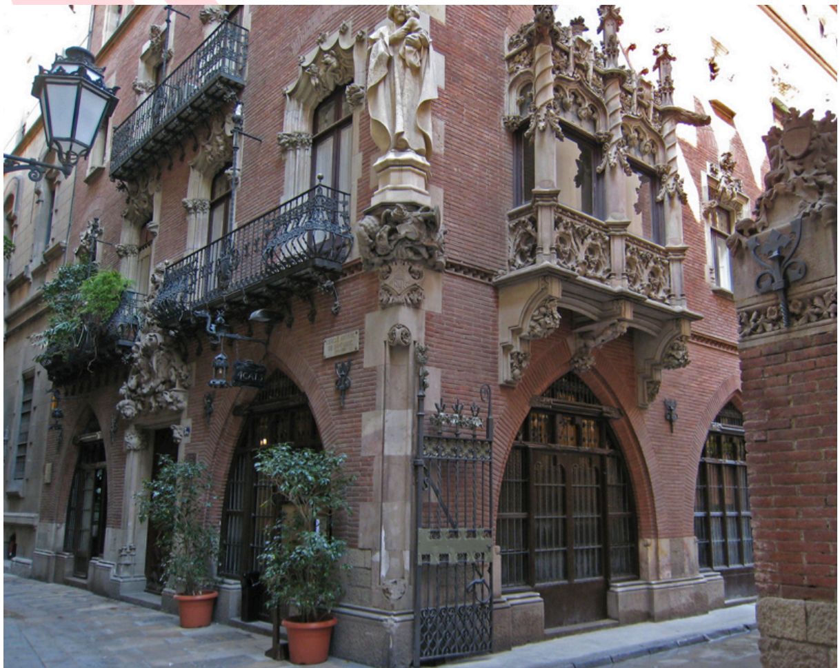
Café 4 cats/ quartier gothique de Barcelone