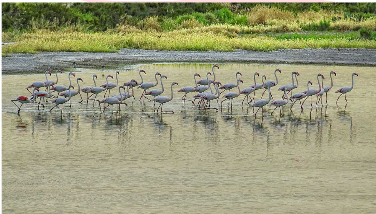
Parc naturel El Torcal Antequera